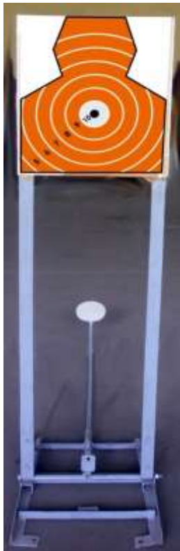
Imagine nr.1 Vedere frontala- pozitia tinta ridicata