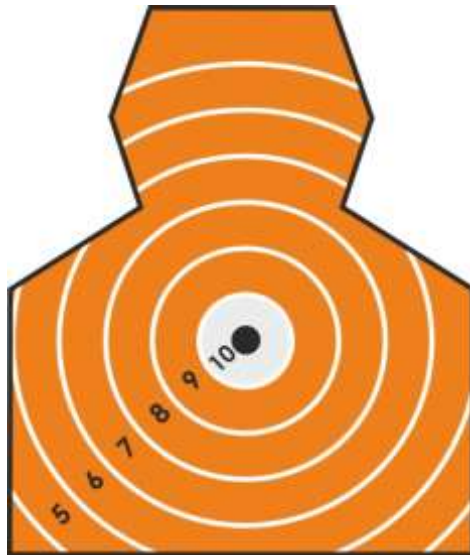
Imagine nr.2 Vedere frontala-tinta