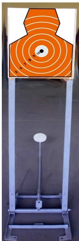
Imagine nr.1 Vedere frontala – pozitia tinta ridicata