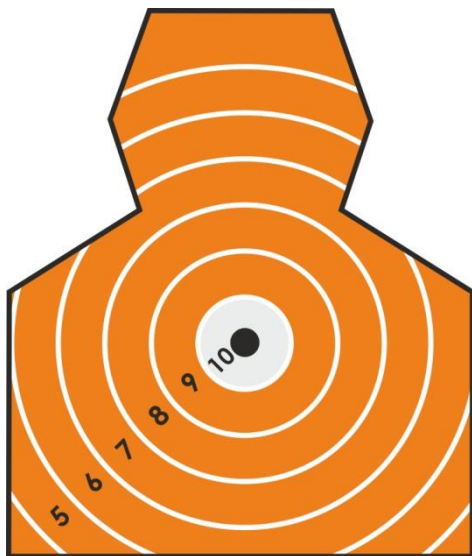
Imagine nr.2 Vedere frontala – tinta